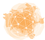
SCHÉMA DIRECTEUR ÉNERGIES Caenlamer