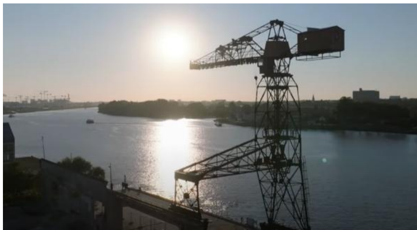
La Grue noire - Nantes - chantier Lassarat et Manang

Il se déroulera en plusieurs étapes sur une durée d'environ 6 mois, de fin octobre 2024 à fin avril 2025 avec :