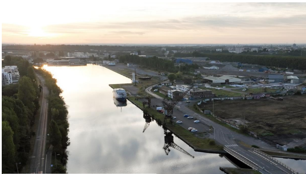
Le canal et ses grues

Dans le cadre du projet de réaménagement de la presqu'île de Caen, les deux grues portuaires Caillard, vestiges du passé industriel du site portuaire, seront un marqueur fort de son identité. C'est pourquoi, le projet du Nouveau Bassin prévoit la mise en valeur de l'histoire du lieu par la conservation du patrimoine : rails, pylônes, charpentes métalliques... Ces grands éléments deviendront ainsi les jalons d'une grande promenade maritime au bord du canal.