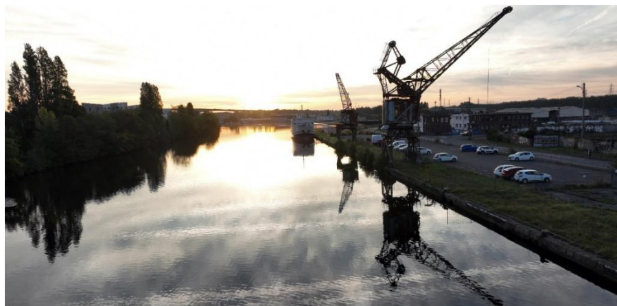
Le canal et ses grues