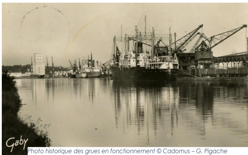
Photo historique des grues en fonctionnement