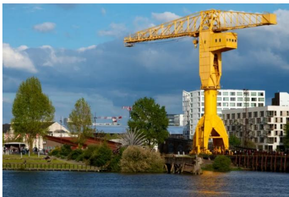
La grue titan jaune, un des symboles de la ville de Nantes

Après une consultation d'architecture, les études de conception et le suivi de la réalisation du projet ont été confiés à un groupement interdisciplinaire constitué de YAP Architecture, Ibatec et Ingé-Infra.