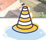
Image non contractuelle.